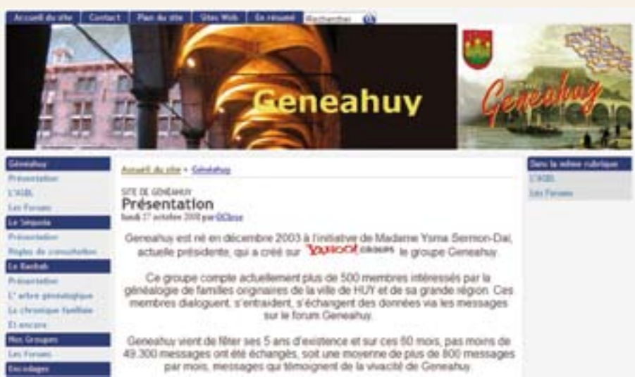
Page d'accueil du site Internet de Geneahuy.

Il publie également un « courrier de l'entraide », pour les questions et réponses des membres, et depuis 1952, des « Recueils » présentant de très sérieuses études généalogiques sur de nombreuses familles en Belgique. Le Centre de documentation de l'Office Généalogique